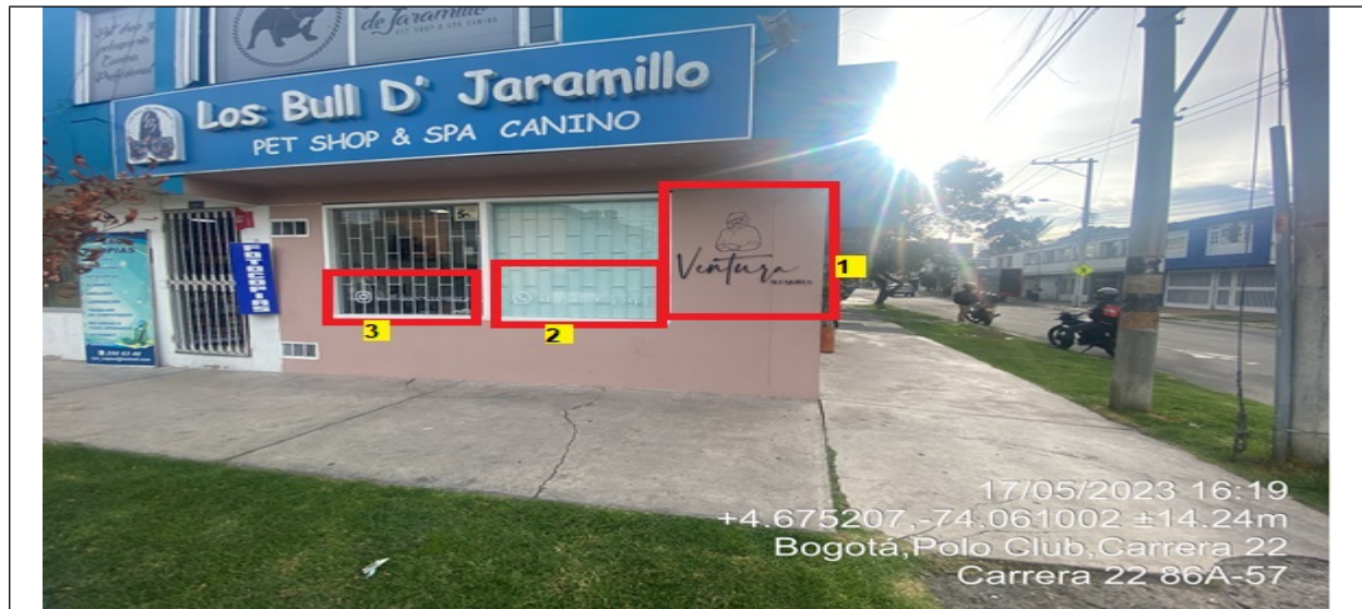
En la cual se evidencia la fachada del establecimiento comercial VENTURA PRODUCTOS ARG con vista sobre la CR 22, en la que se observa: un (1) elemento publicitario identificado con el número 1, el cual al momento de la visita no contaba con el registro ante la SDA. Así mismo, dos elementos publicitarios identificados con los números 2 y 3 los cuales se encuentran ubicados en las ventanas de la edificación.