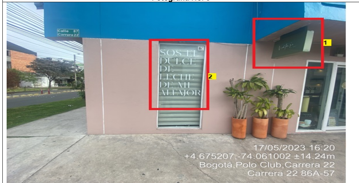
En la cual se evidencia la fachada del establecimiento comercial VENTURA PRODUCTOS ARG con vista sobre la CL 87, en la que se observa: un (1) elemento publicitario identificado con el número 1, el cual está volado de la fachada del establecimiento, así mismo un (1) elemento PEV identificado con el número 2 ubicado en las ventanas de la edificación.